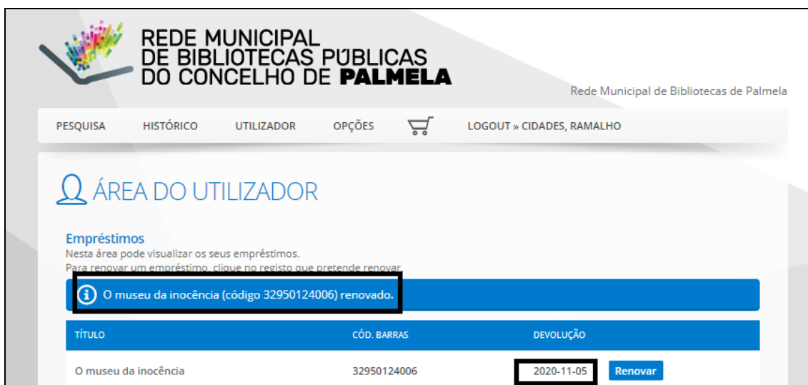
Figura 6 – Confirmação da renovação

Nota: A plataforma indicará que o seu empréstimo foi renovado e apresentará a nova data de devolução .