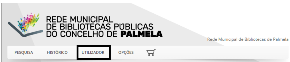
Figura 2 – Acesso à Área do Utilizador