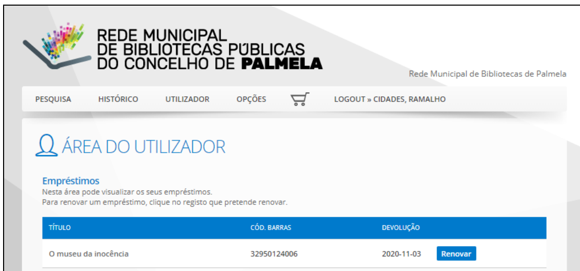
Figura 5 – Renovação de empréstimo

Nota: A plataforma indicará que o seu empréstimo foi renovado e apresentará a nova data de devolução .