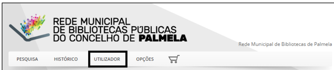
Figura 2 – Área Utilizador